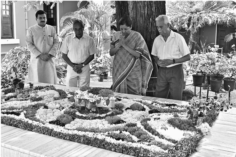
At the Samadhi

LA VISITE DU MINISTRE INDIEN DE LA DÉFENSE, SHRIMATI NIRMALA SITHARAMAN