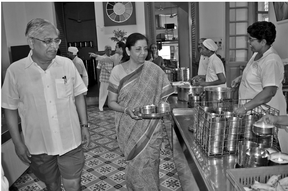
At the Dining Room