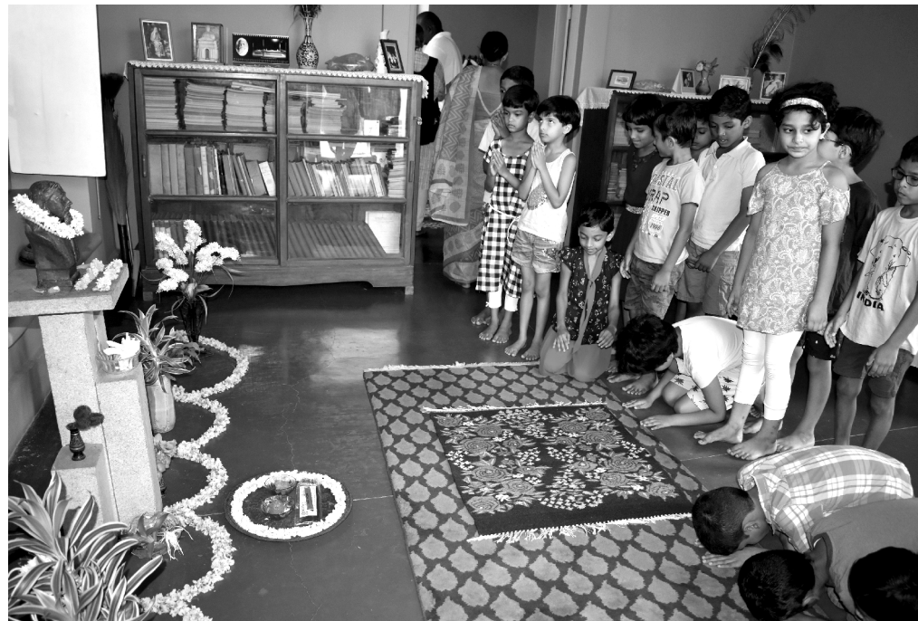
Children visiting Sri Aurobindo's Room at Guest House – 29.3.2019