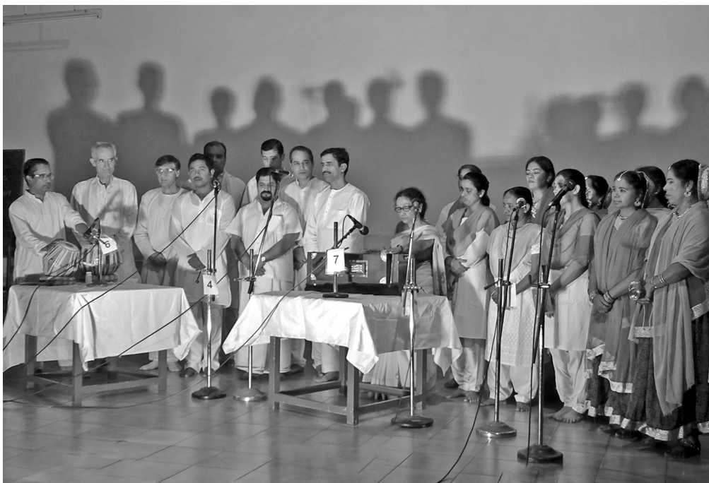
A variety programme at the Dining Room