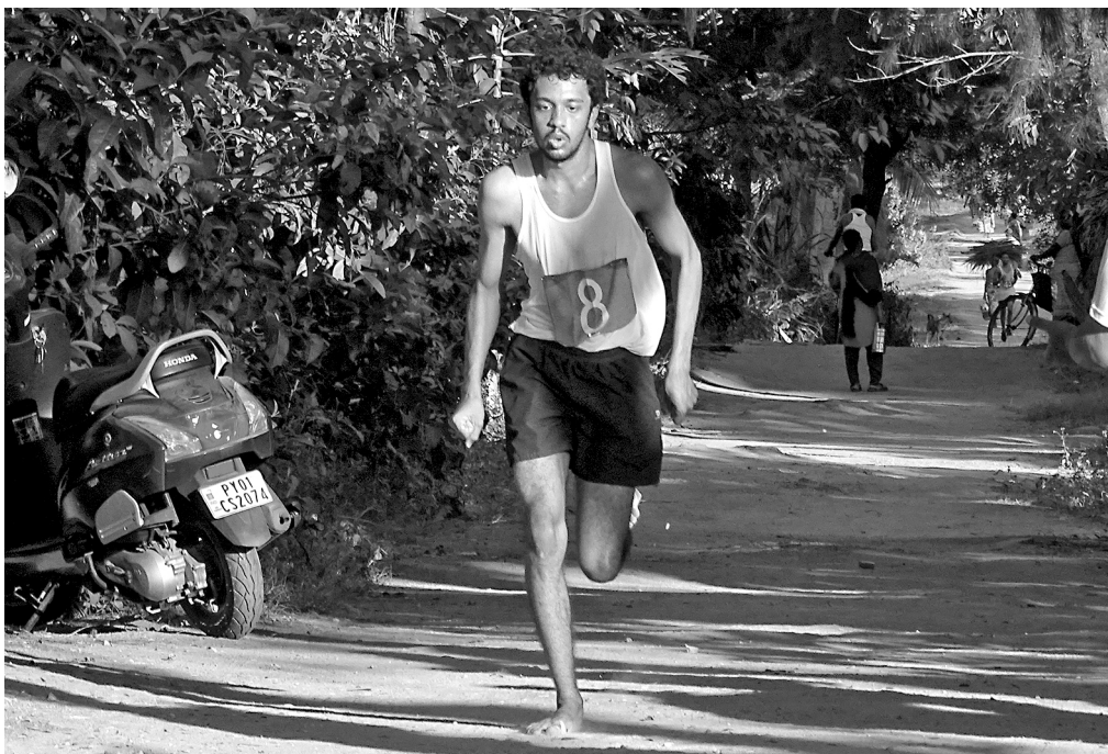
Cross-country road race