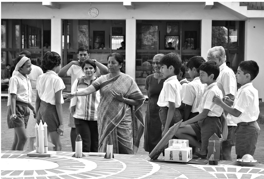
SAICE: interacting with children