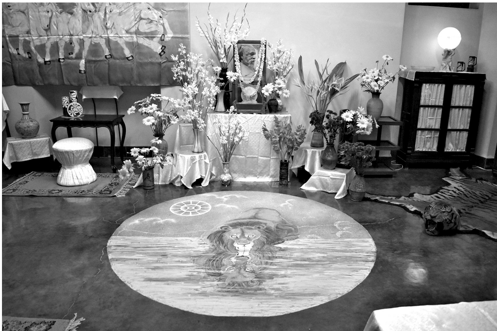
Decoration in the Mother's Room in the Playground