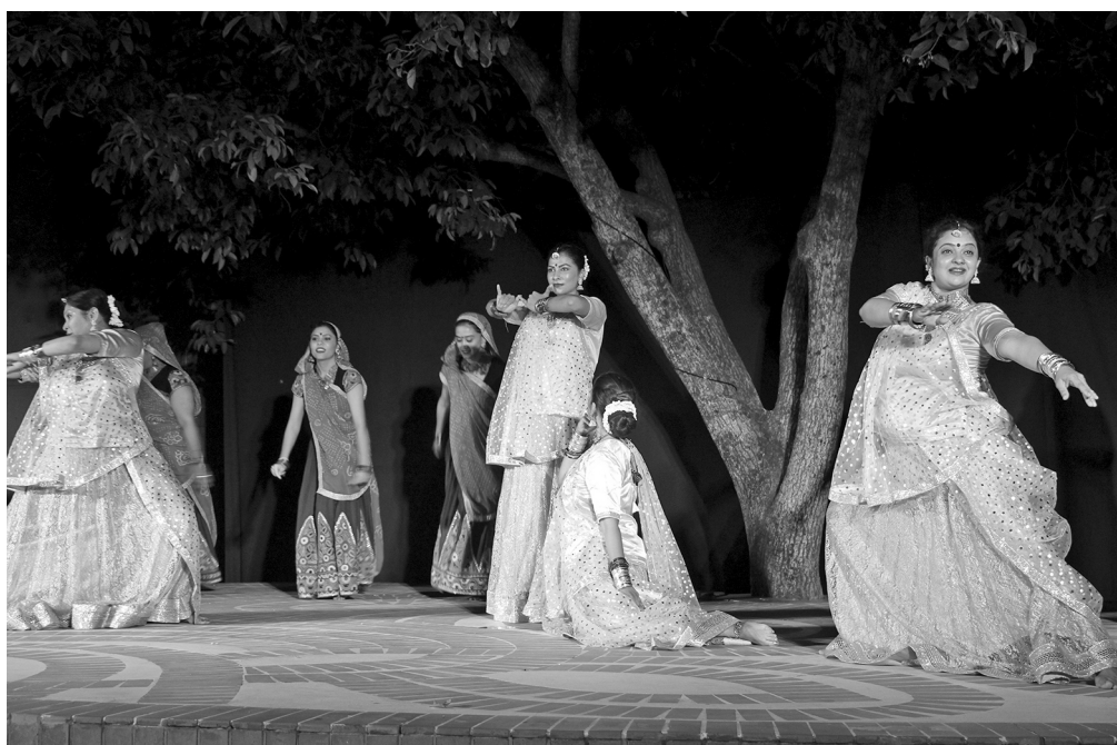
Folk dances by the Aaviskar group