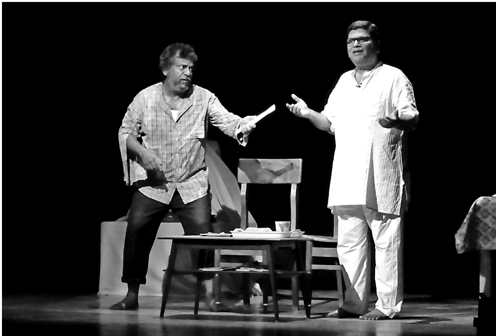
'Bijoyee' – a Bengali play