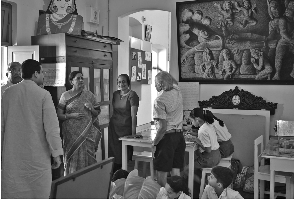
SAICE: in the Art Room