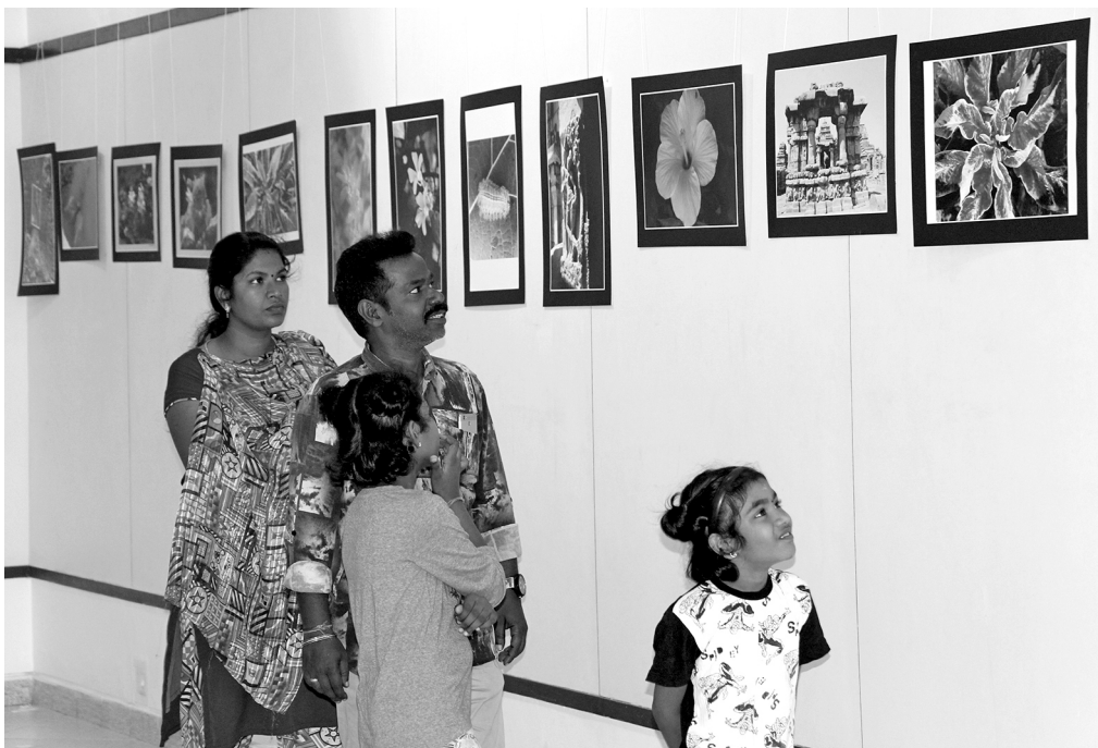
An exhibition of painting