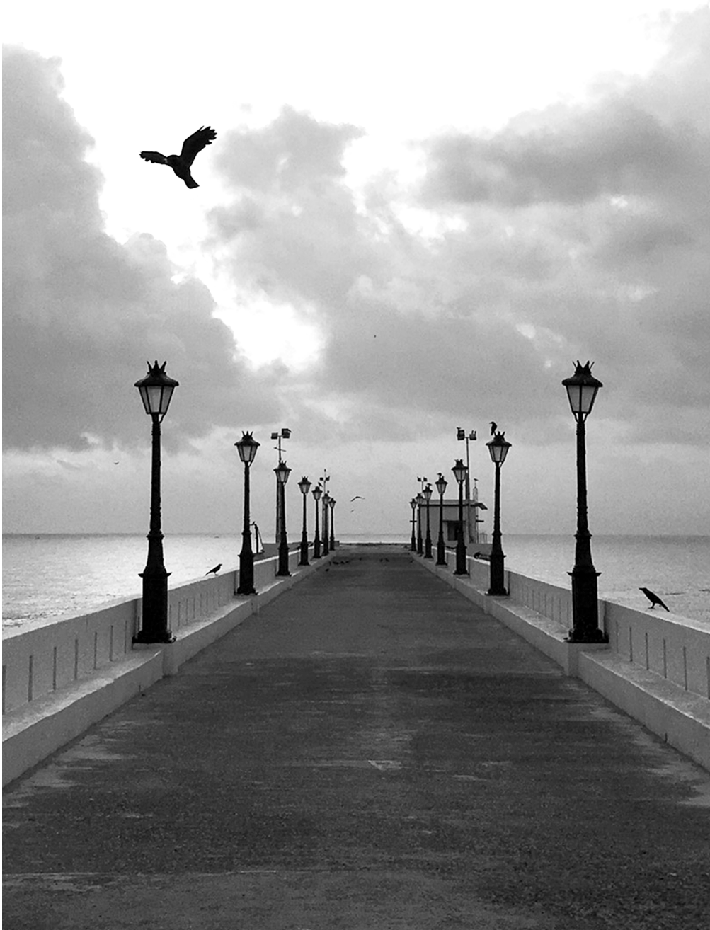
'New Pier' at Pondicherry